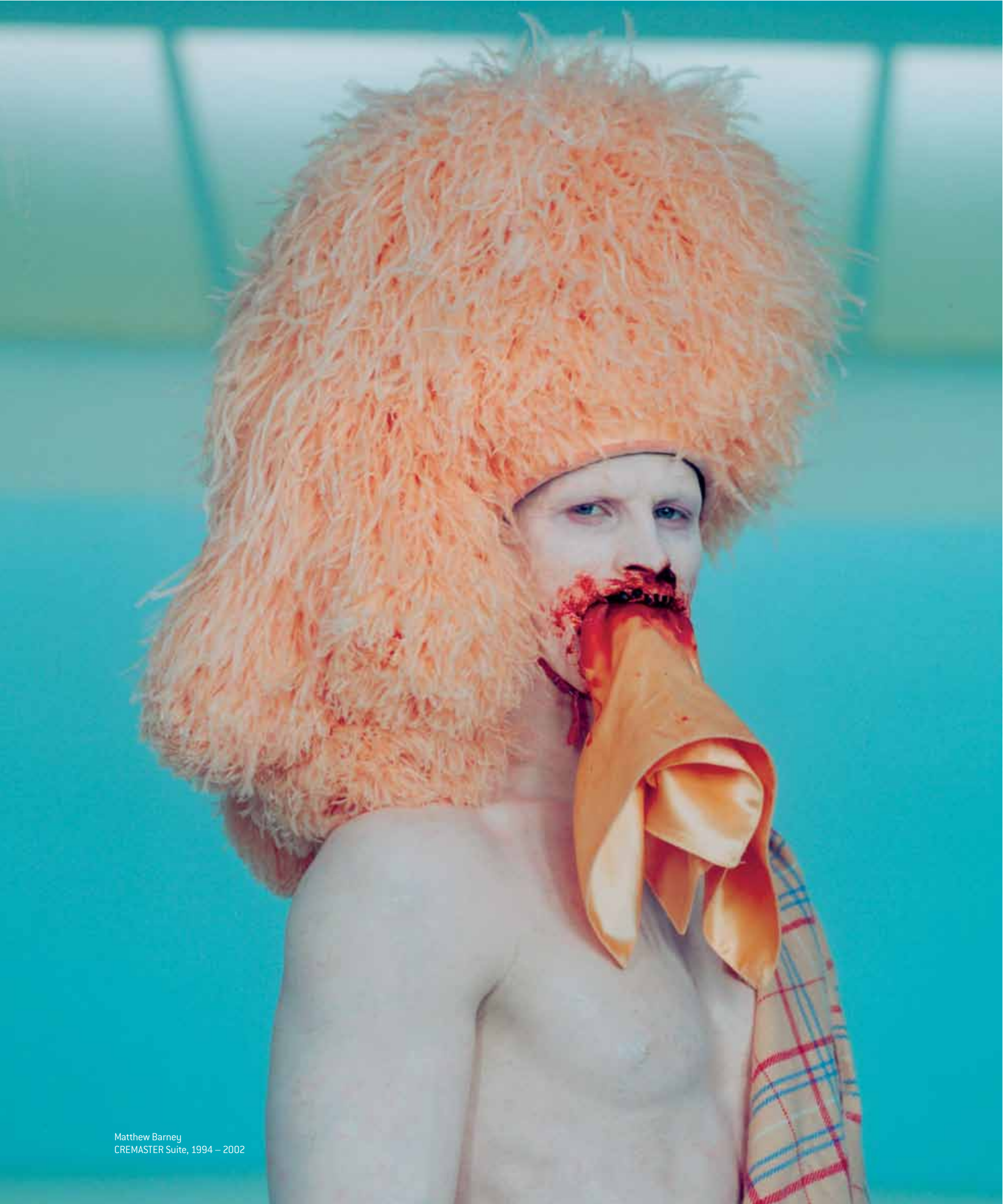
Matthew Barney CREMASTER Suite, 1994 – 2002