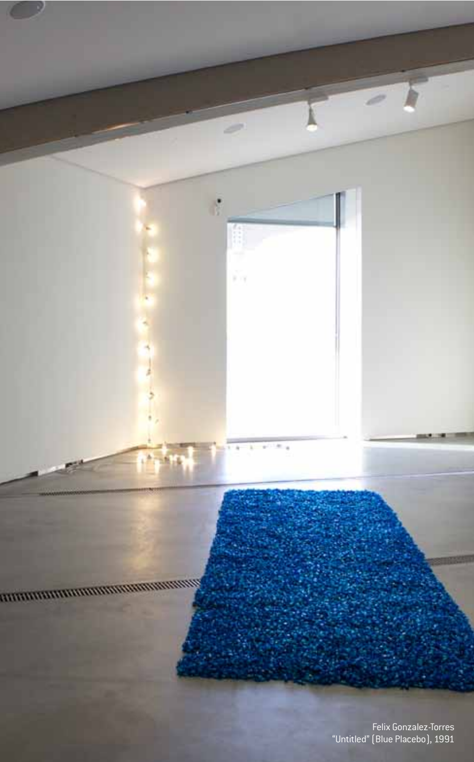
Felix Gonzalez-Torres "Untitled" (Blue Placebo), 1991