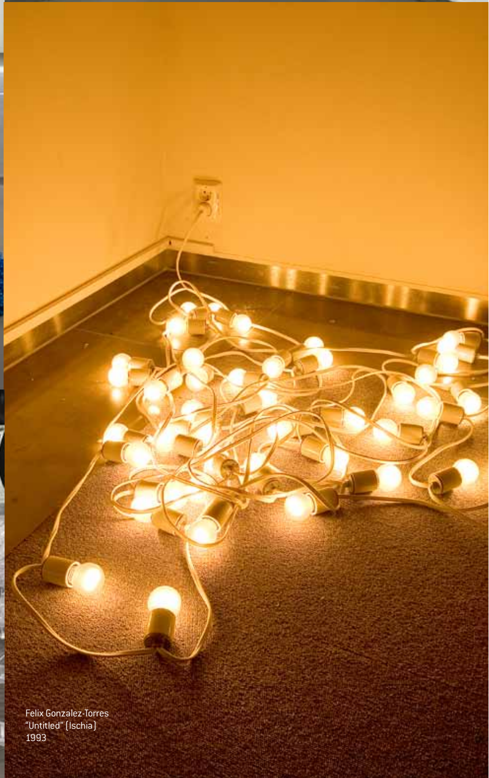
Felix Gonzalez-Torres "Untitled" (Ischia) 1993