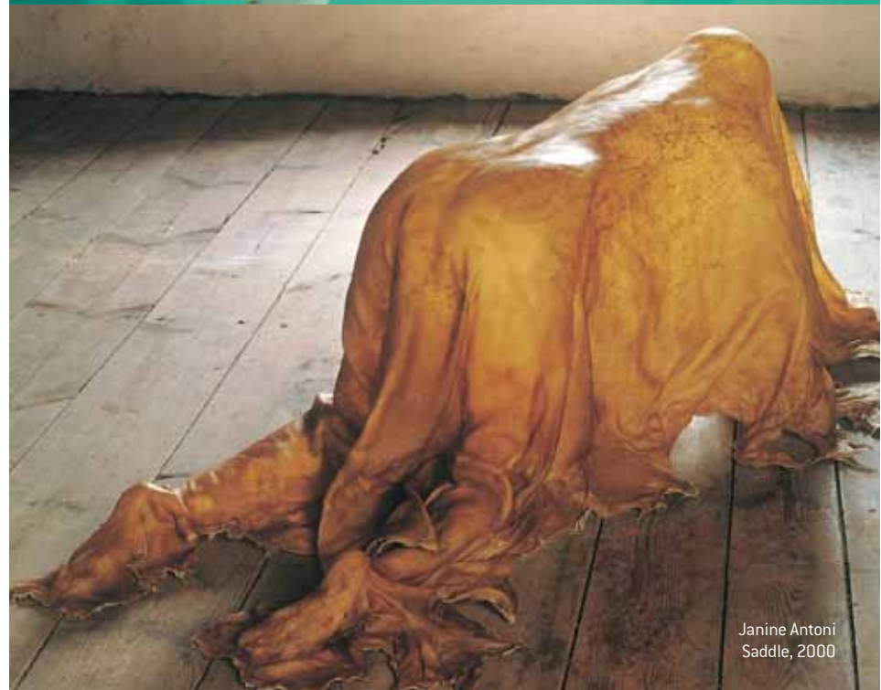
Janine Antoni Saddle, 2000