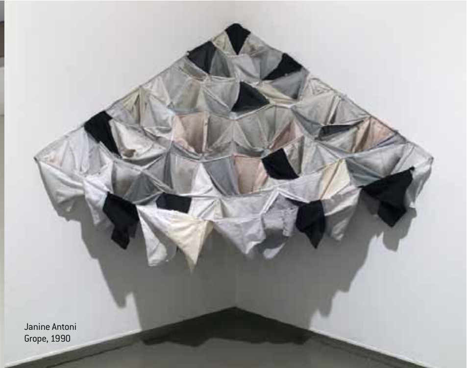
Janine Antoni Grope, 1990