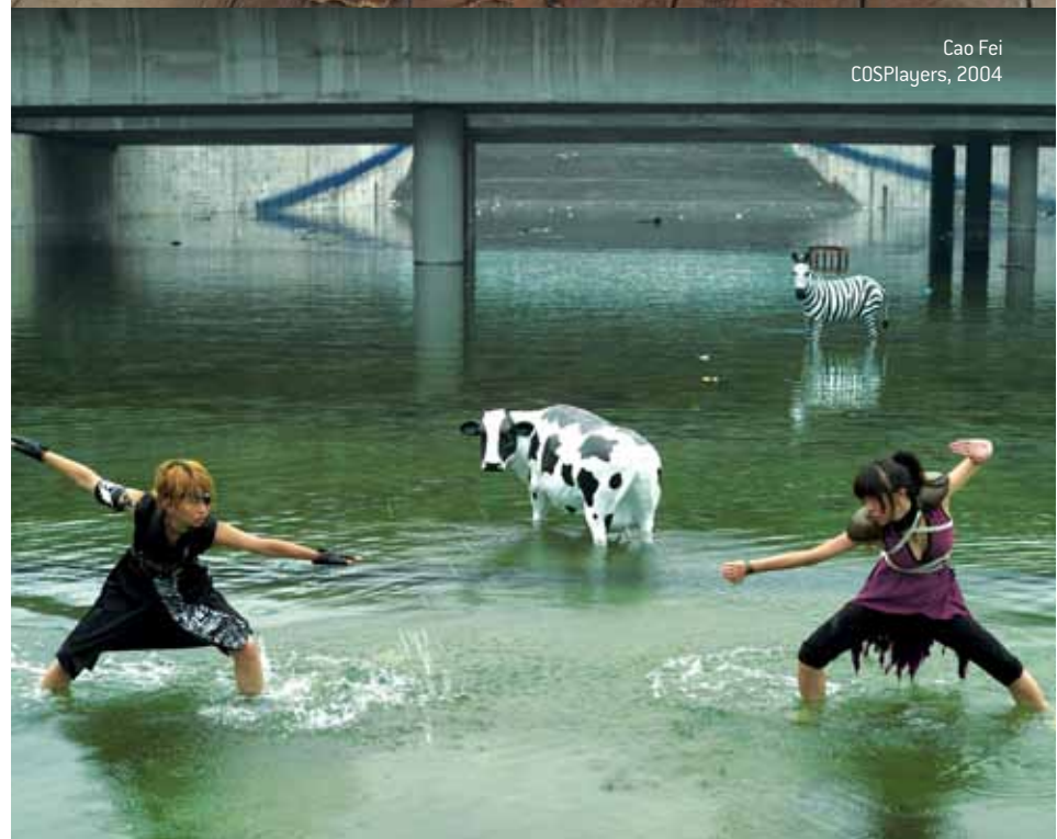
Cao Fei COSPlayers, 2004